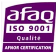
ISO 9001 & ISO 22000