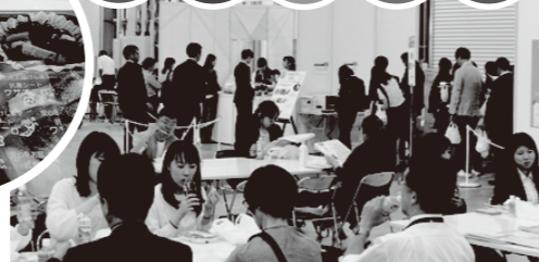
ifia/HFE JAPAN2019の企画弁当販売エリア