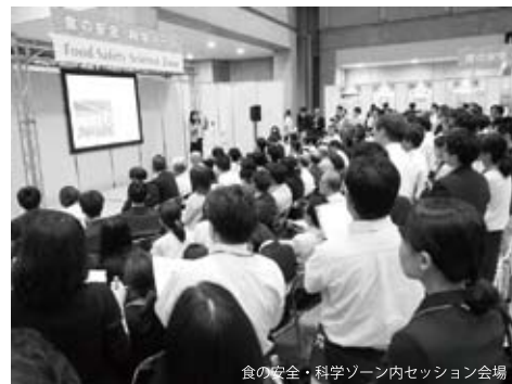
食の安全・科学ゾーン内セッション会場

会期中、多くの食に携わる専門家が来場し、展示エリアのみならず各種セミナー会場も盛況となった。おいしさと健康の垣根がなくなりつつあるなか、会場内では健康・機能性食品分野に向けた食品素材・添加物メーカーのアプリケーション開発や加工食品分野へ対する健康・機能性素材メーカーの提案などが積極的に図られるなど、今年のテーマである“良食体健”を具現化した展示内容となった。